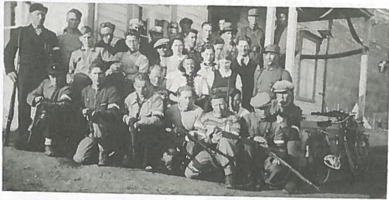
Noen av vaktene ved den tyske fangeleiren på Vårheim i Øverbygd våren 1940. Mange bygdefolk vil nok se kjenninger på bildet. Vaktene var frivillige sivile, rekruttert gjennom skytterlagene i bygda. Mange av dem kunne nok ennå ha interessante ting å berette fra denne tida.

— Men nå var det klart for alle og enhver at fien-