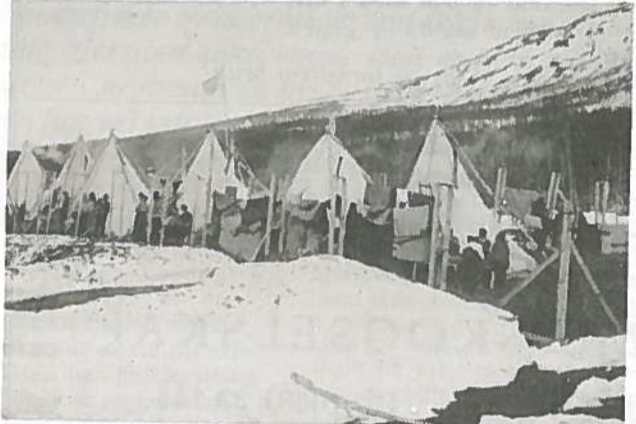
Slik så fangeleiren ut.

Statsminister Nygaardsvold og utenriksminister Halvdan Koht var ofte ute på spaserturer om kveldene. Folk meinte de var uforsiktige, det måtte jo ikke sive ut at de var gjømt her oppe i bygda. Men de måtte vel ha frisk luft og mosjon, sjøl om de var på flukt.