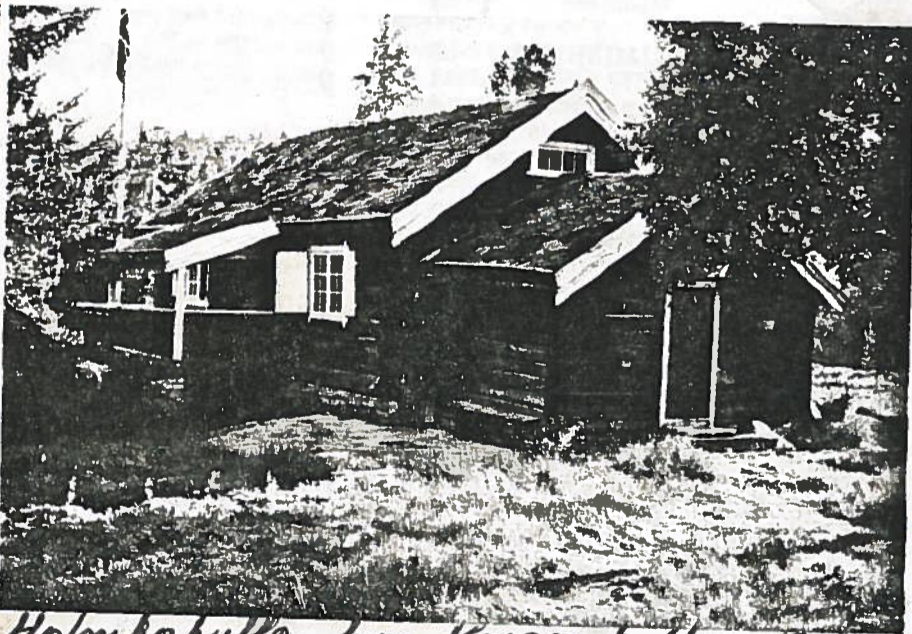
Holmboehytta hvor Kongen bodde i 1940

Også andre personer som «Nordlys» unntak inn for løsrivelse fra Målselv stendighetsønsket større jo lenger en k