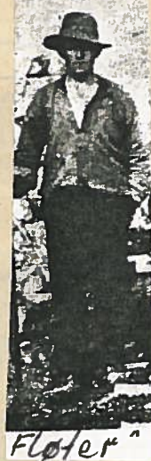
«Fløter» Tømmerfløtinga i indre Troms er en saga blott. Men på skogdagen til Statens skoger sist sommer fikk man demonstrert hvordan fløtinga foregikk.