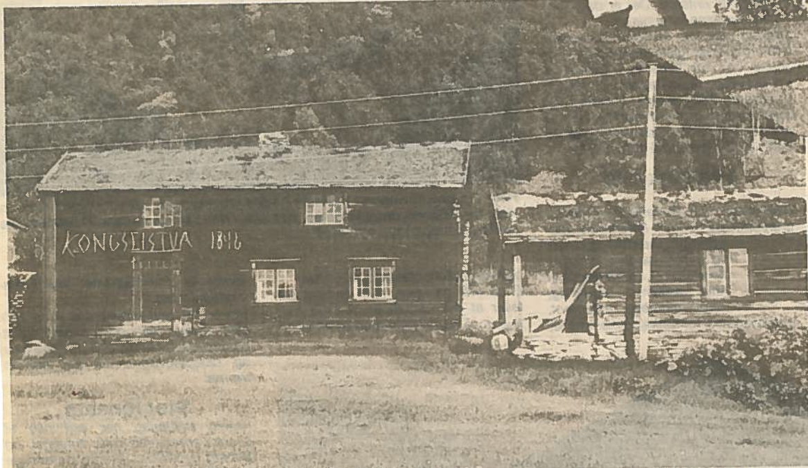
Kongslistua fra 1846. Det er meningen at den skal flyttes nedover til Øverby gård, 1 km nedenfor Råvatn. Der det er planer om et bygdetun for Øverbygd.

Videre innover er det en fantastisk vakker natur som Rostaelva bukker seg igjennom. Og selv om du ikke som i tidligere dager kan regne med å få 3-4 kilos ørreter i Rostaelva, så er det god bestand av ørret og til dels røye og harr. For noen år siden ble det åpnet en bomvei fra Innset oppover dalen, og det forkorter turen til Rostahyttene med ca en time.