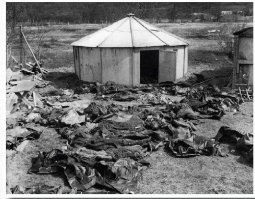
KVSMENES: Døde russiske krigsfanger fotografert ved Kvesmenes i 1945.

EKSKLUSIVT for Nordlys-abbonenter og Tidning +