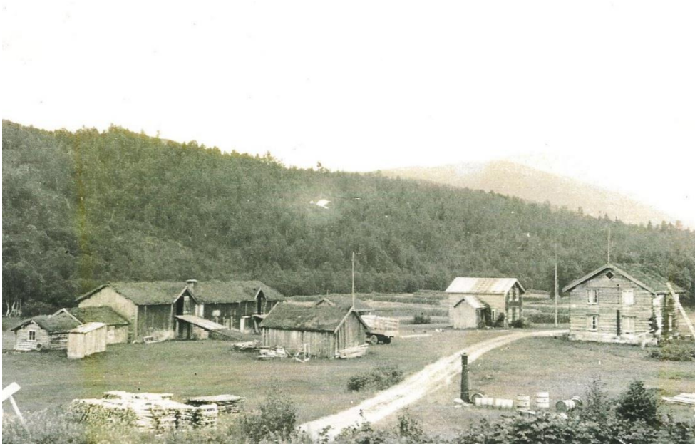
Nedre Sletten ca 1900