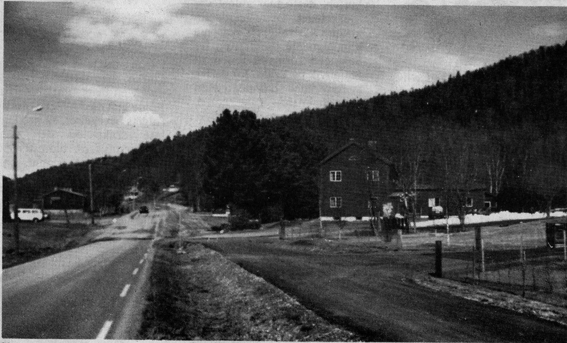
Skogforvaltergården mai 1988. Hele bygningen med uthus er i dag gjort om til kontorlokaler. De store sembrafuruene er 64 år. Garasje og stall for mer moderne hester, snøscootere, er ført opp på baksida. Bygdevegen er asfaltert og utbedra med gangveg parallellt.