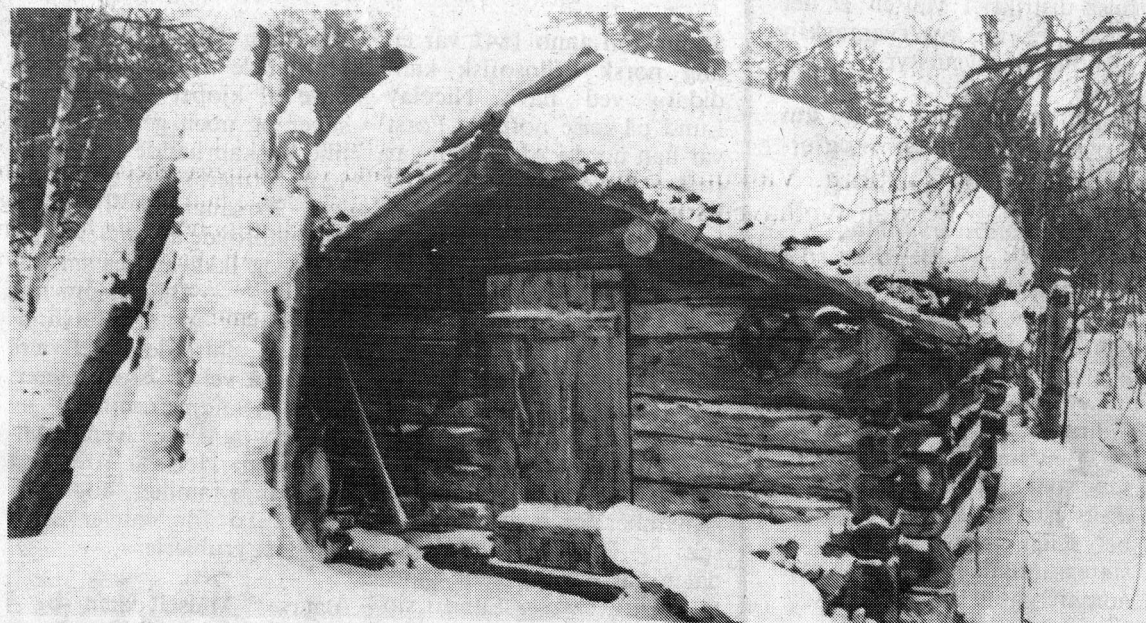
Vetlenesbu var trolig oppført rundt århundreskiftet som skogsstue. I dag et fint kulturminne som står som åpen hytte.

Som forholdene er her nu akter jeg heller ikke at holde egen hest. Det har hittil ikke vist sig at være vanskelig at få skyss selv om såvidt jeg vet alle skyssstasjoner i bygden er ned-