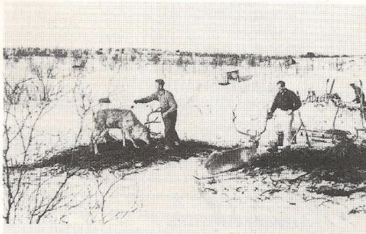
Magnus Skog og Oddleif Skogstad fører kjørereinene nede i Laimolathi.

Øverbygd, september 1983 ERLING HEGGELUND