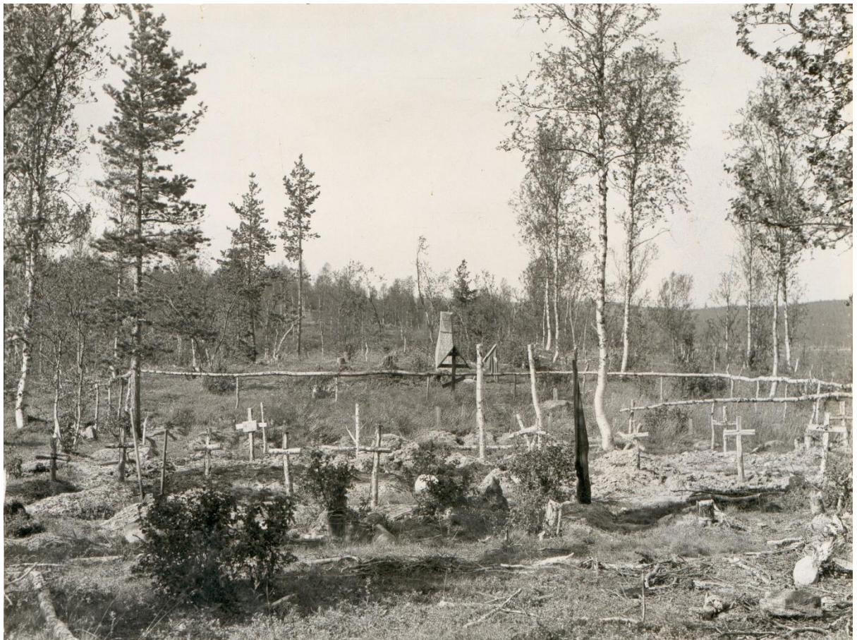
Dette er et bilde av kirkegården på Rustahøgda (Russehøgda).

Operasjon Asfalt var navnet på en aksjon som handlet om å flytte krigsfanger til Tjøtta på Helgelandkysten. Først ble de gravlagt på ulike plasser som Øverbygd, Rustahøgda (Russehøgda) og Målselv kirkegård, men i 1951 bestemte norske myndigheter at de skulle flytte krigsfangene til Tjøtta. Dette skjedde fordi de var redd for russisk spionasje. De var redde for at russerne skulle bruke besøk på kirkegårdene som en mulighet for å spionere på Bardufoss flyplass og andre forsvarsanlegg under Den kalde krigen.