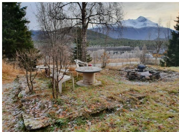
Her ser vi restene av grunnmuren til huset på Bergli gård.