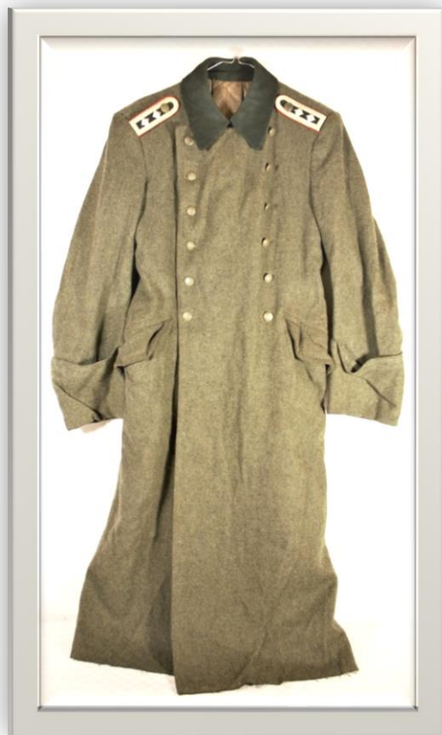
Dette er en tysk frakk av vadmelfstoff. https://digitaltmuseum.no/021028322453/tysk-offiserfrakk