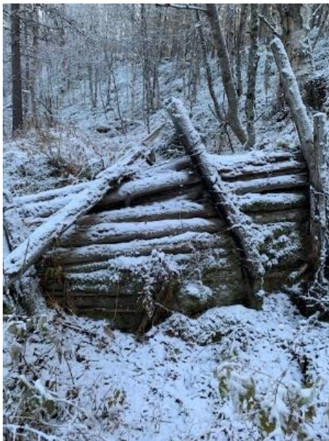
Rester av en gjenstående vegg på en av fangebrakkene.