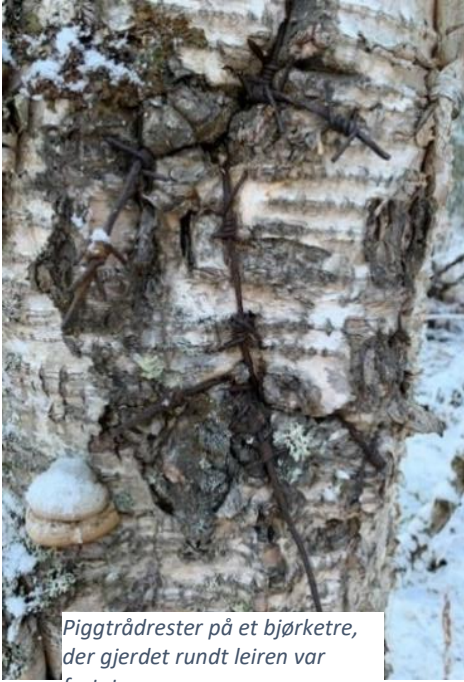
Piggtrådrester på et bjørketre, der gjerdet rundt leiren var festet.