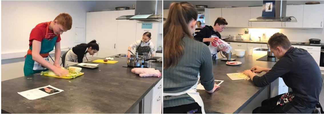
9A på kjøkkenet for å lage kålsuppe og anna mat fra krigens dager.

Elevene måtte først smake på suppen slik den var laget, men fikk etterpå lov til å krydre med salt og pepper. De elevene vi snakket med syntes det var en god måte å få forståelse av hvor lite mat krigsfangene hadde tilgjengelig, og hvor lite maten smakte.