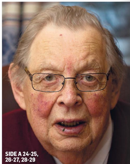
SIDE A 24-25, 26-27, 28-29