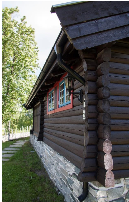
3. til venstre. Del av berande søyle på terrassa. Utsmykking med markant profilering.. til høgre. Langvegg sett mot sør. Viser det solide tømmeret og dei kraftige lafteknutane og rommarkeringa med dekorativ svung nedst.