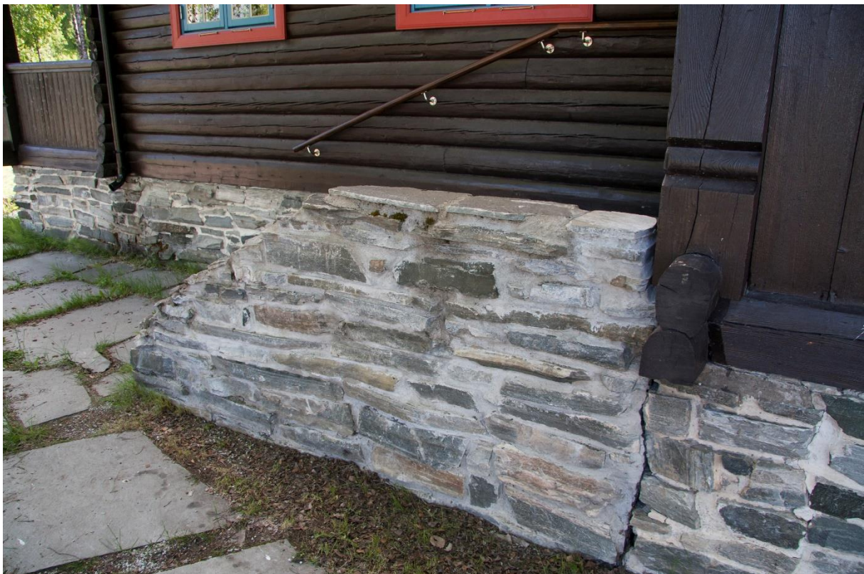
4 – Grunnmur i naturstein, truleg frå steinbrot ved Andsvatnet.