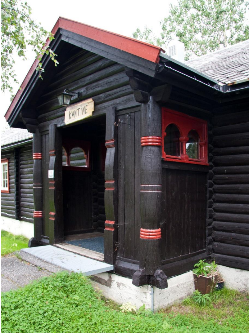
15. – Høgtun. Inngangspartiet til kantina. Detaljane viser nasjonalromantisk preg : profilerte søyler og vindusrekker inspirert av middelaldersk kyrkjearkitektur.