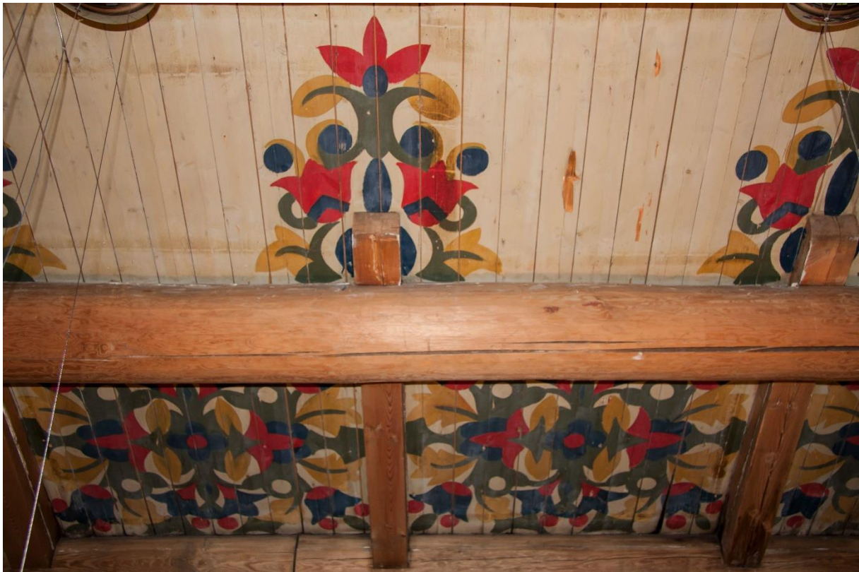
8 – Utsmykking av åstaket i hallen. Truleg inspirert av tysk folkekunst.