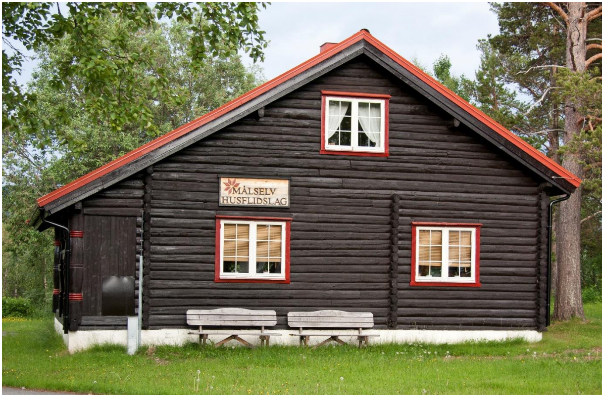
13 – Hytta på Høgtun.