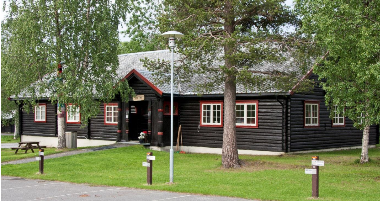
12 . Høgtun. Kantina på Høgtun frå tida som vidaregåande skole. Bygningen blei sett opp i 1942 som administrasjonsbygning i Todtleiren som blei bygd her.