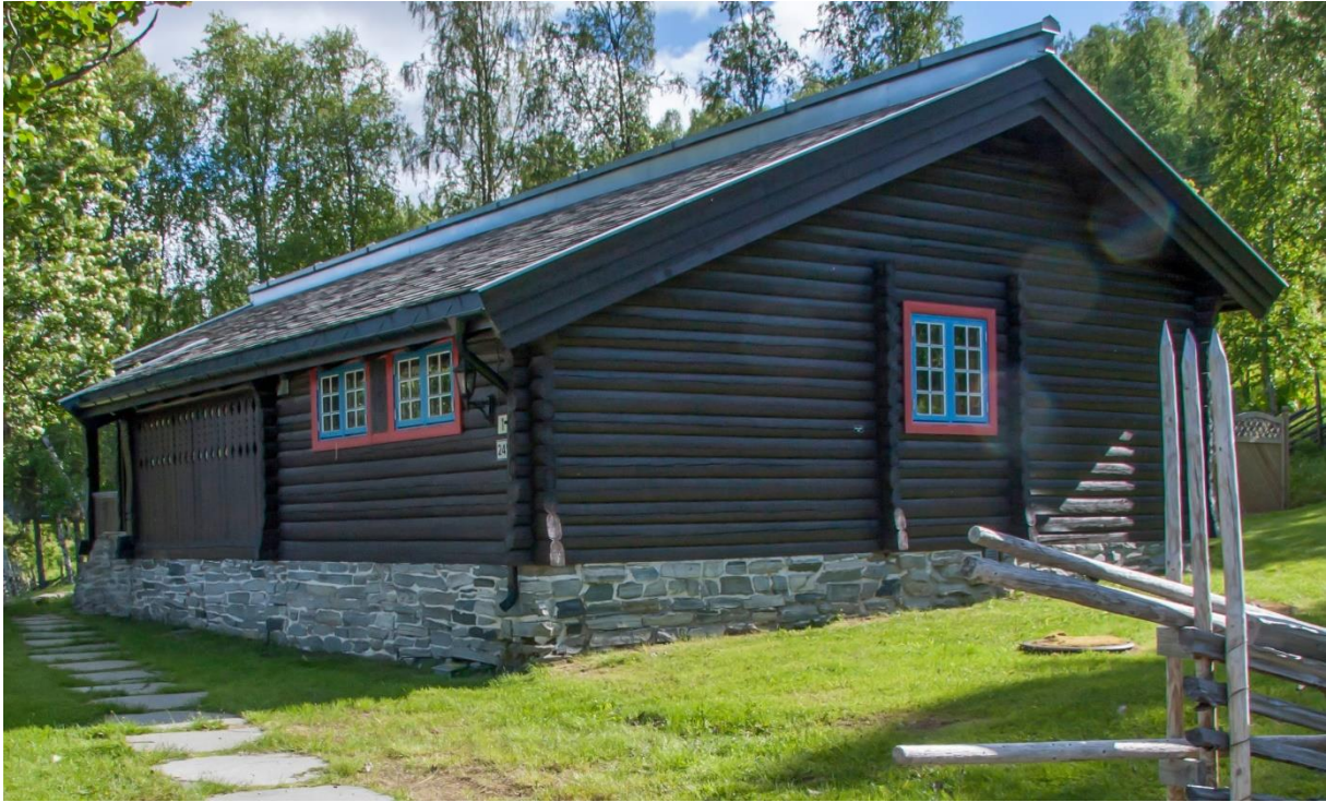
1 Kongehytta sett mot sørvest. Til høgre i forgrunnen ser ein ein del av skigarden som omkransar Kongehytta og annekset.