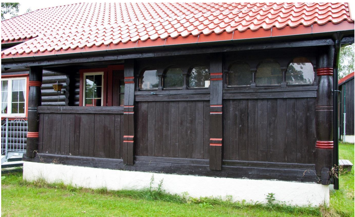
14 -Inngangspartiet på Hytta, Høgtun. Partiet er bygd som svalgang i stavkonstruksjon med profilerte stavar/søyler. Også her er vindusrekkene inspirert frå middelalderkyrkjer.