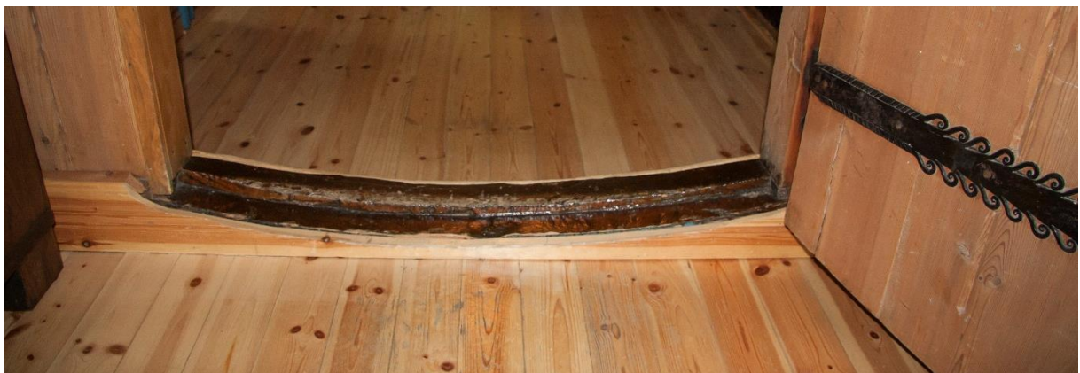
7 – Bua dørterskel mellom hall og gang