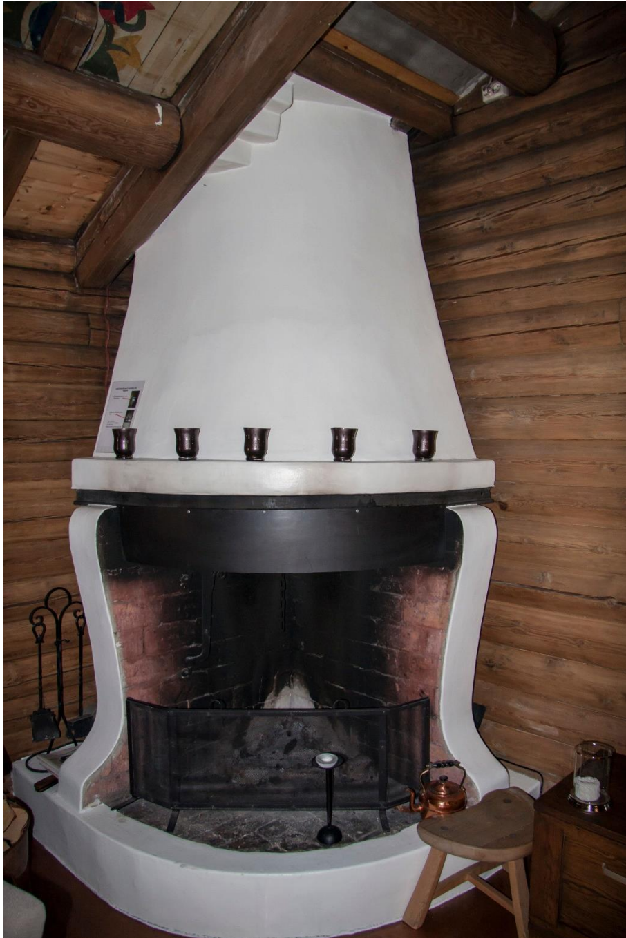
11 – Peisen har ein dominerande plass i hallen.