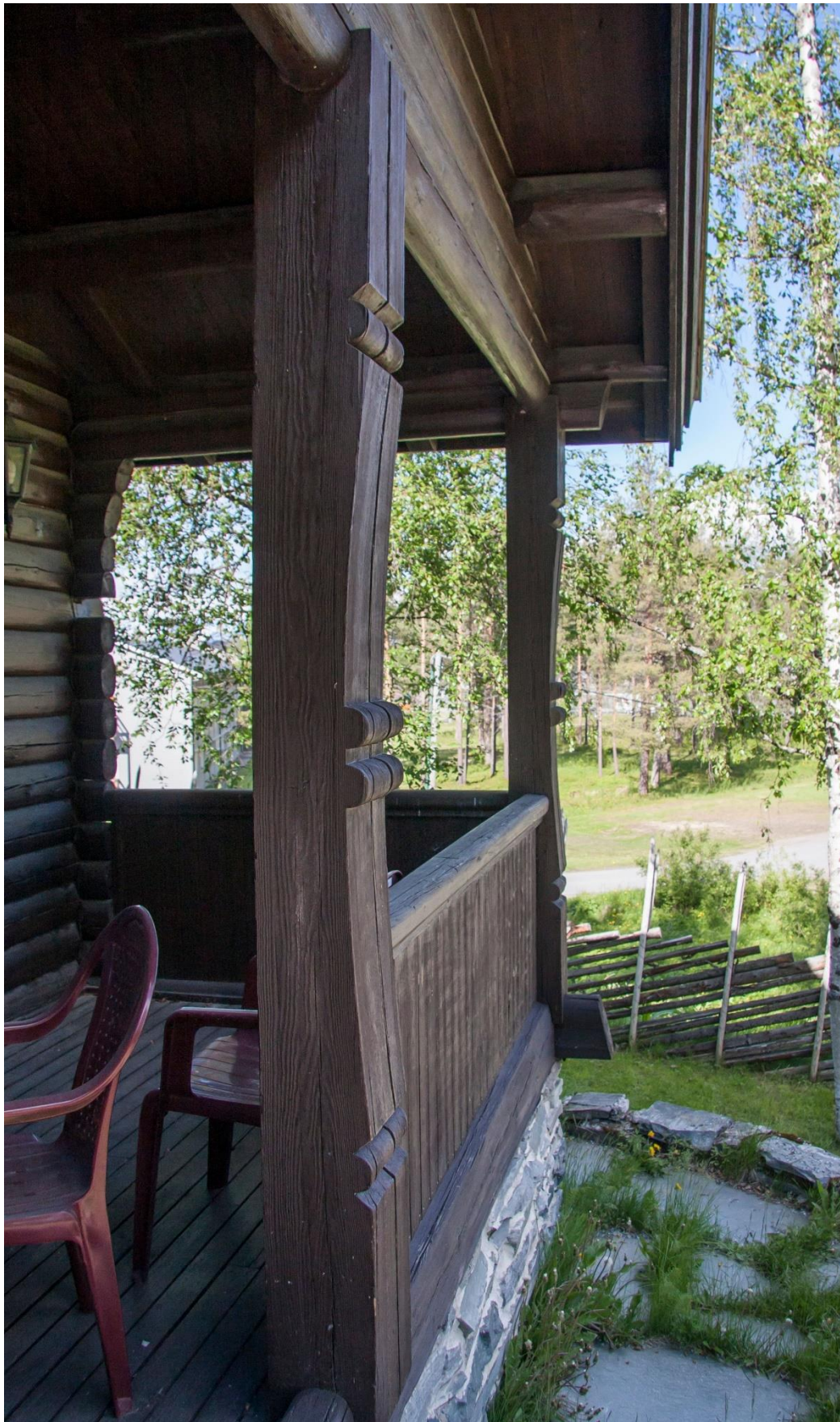
5 – Dekorativ søyle til den overbygde terrassa.