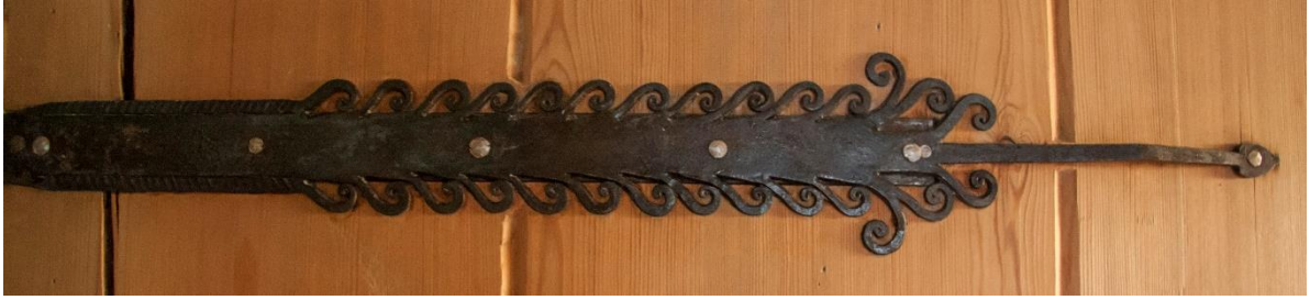
10 – Smedarbeid.