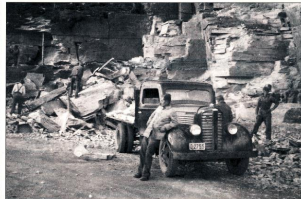
TYSKE ARBEIDERE: 4. kompani av den tyske arbeidstjenestens avdeling 360 deltok i utbygginga av flybasen på Bardufoss for 70 år siden. Kompaniet ankom Bardufoss i juni 1940. Bildet ble tatt ved Andsvatnet.