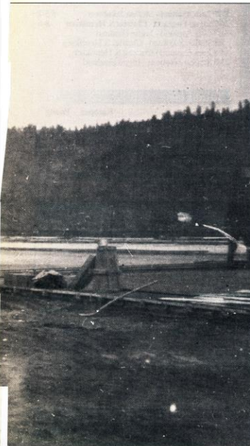
ss for 70 år siden. I bakgrunnen kommer et transportfly av typen

Så sent som i midten av november 1940 var trafikkkontrollposten fortsatt i drift, men da hadde man bare en vaktmann. Han var på sin post ved brua på de tidene av dagen da trafikken var størst. Det vil si fra klokka 07.00 og utover formiddagen og fra klokka 16.00 til 19.00. Den største trafikken over brua var fra klokka 16.30 til 17.30 da det ordnere arbeidsskiftet sluttet.