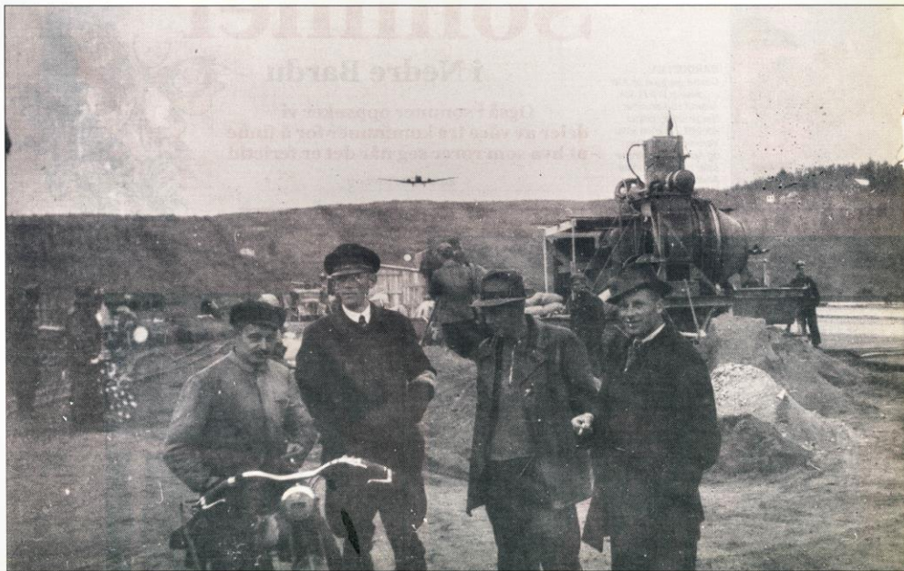
INN FOR LANDING: Sivile arbeidsledere foran en betongblandemaskin på Bardufoss sommeren 1940. Om lag tusen norske arbeidere deltok i utbygginga av den tyske flybasen på Barc Junkers Ju 52 inn for landing.