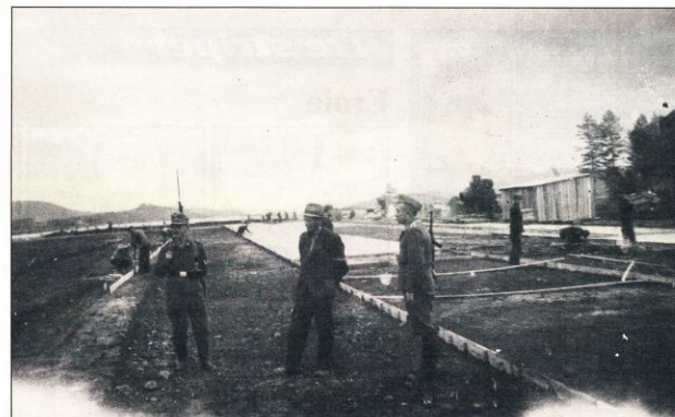
TYSKE VAKTER: Fra arbeidene på betongrullebanen på Bardufoss sommeren 1940. Tyske soldater sto for vakthold et under utbygginga av flybasen. Mannen i midten er en arbeidsløder.