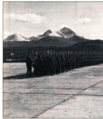
FLYPLASSBYGGERE: Mannskaper fra den tyske arbeidstjenesten marsjerer over betongrullebanen på Bardufoss høsten 1940.